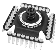
SR-32 BS-010205-FK ротор