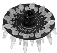
R-0.5/0.2 BS-010205-BK ротор

Ротор для 12 x 0.5 мл и 12 x 0.2 мл пробирок