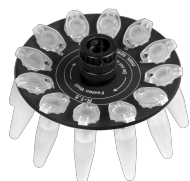
R-1.5 BS-010205-AK ротор

Ротор для 12 x 0.5 мл и 12 x 0.2 мл пробирок