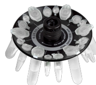
R-2/0.5/0.2 BS-010205-DK ротор

Ротор для 8 x 2/1.5 мл и 8 x 0.5 мл пробирок