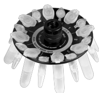
R-2/0.5 BS-010205-CK ротор

Ротор для 8 x 2/1.5 мл и 8 x 0.5 мл пробирок